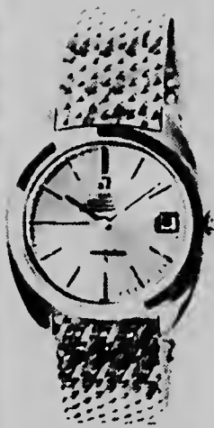
CONSTELLATION CHRONOMETER DE LUXE - Kashi, wijzerplaat, su wijzernan y banchi tur ta di oro di 18 karaat. Automático, shockproof, impermeable, antimagnético, cu calendario. PREJS F. 1,280.--